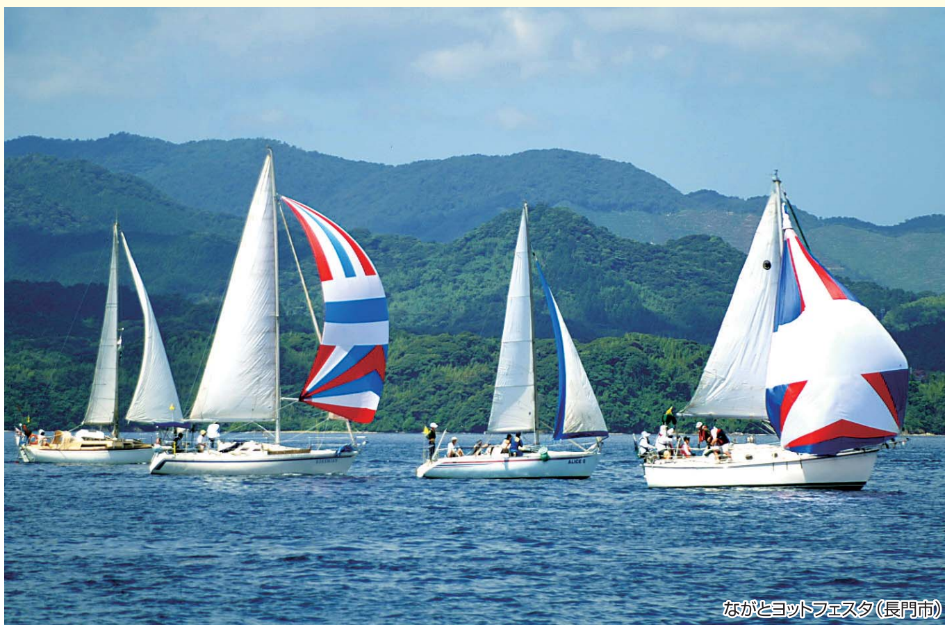
ながとヨットフェスタ(長門市)